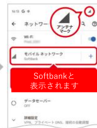
10. アンテナマークが表示されれば設定完了