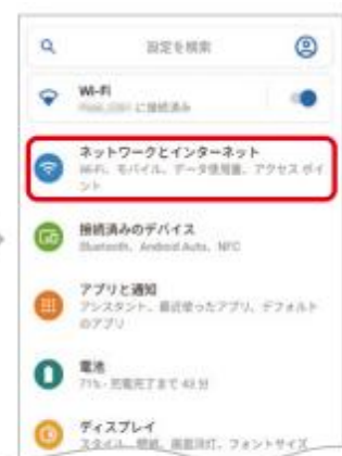
2. 「ネットワークとインターネット」をタップ