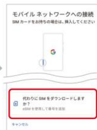
4. 「代わりにSIMをダウンロードしますか?」をタップ