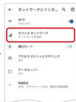
3. 「モバイルネットワーク」をタップ