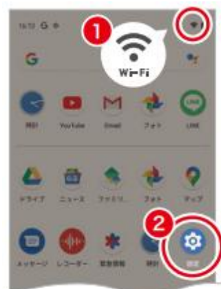
1. Wi-Fi接続を確認し「設定」をタップ