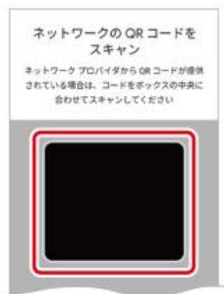
6. ご契約時にお渡ししたQRコードを読み込む